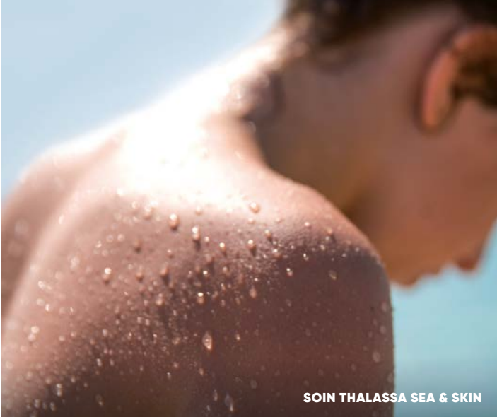
SOIN THALASSA SEA & SKIN