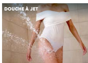
DOUCHE À JET