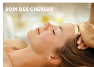
SOIN DES CHEVEUX