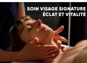
SOIN VISAGE SIGNATURE ÉCLAT ET VITALITÉ