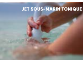
JET SOUS-MARIN TONIQUE