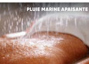
PLUIE MARINE APAISANTE