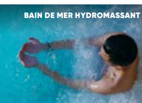
BAIN DE MER HYDROMASSANT

À partir de 1 jour / 3 soins par jour / 1 nuit avec petit déjeuner