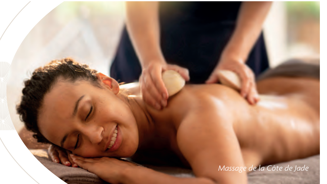
Massage de la Côte de Jade

Un espace raffiné, un savoir-faire subtil qui révèle notre identité singulière... Le plaisir sensoriel de textures onctueuses, de parfums gourmands, apaisants, épicés ou floraux... Soins, rituels ou massages pour favoriser le lâcher prise et l'éveil des sens... La détente vous va si bien.