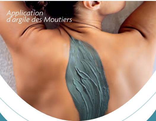
Application d'argile des Moutiers