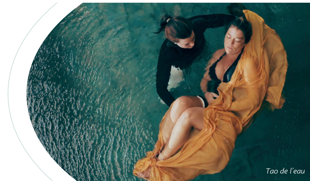
Tao de l'eau